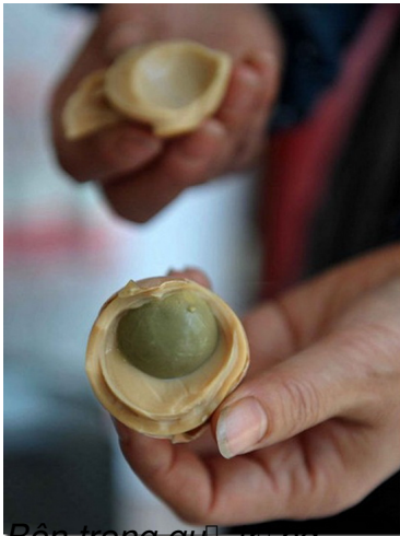
Bên trong qu... u... ng.

Ch... Nh...t, 20 Th...ng 11 N...m 2011 06:58