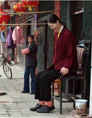
Đã mất 14 năm để lấy được chiếc quần dài 170 cm này. Đây là một kỷ lục Guinness về bệnh còi xương.

Th&#7913; B&#7843;y, 16 Th&#225;ng 7 N&#259;m 2011 03:18