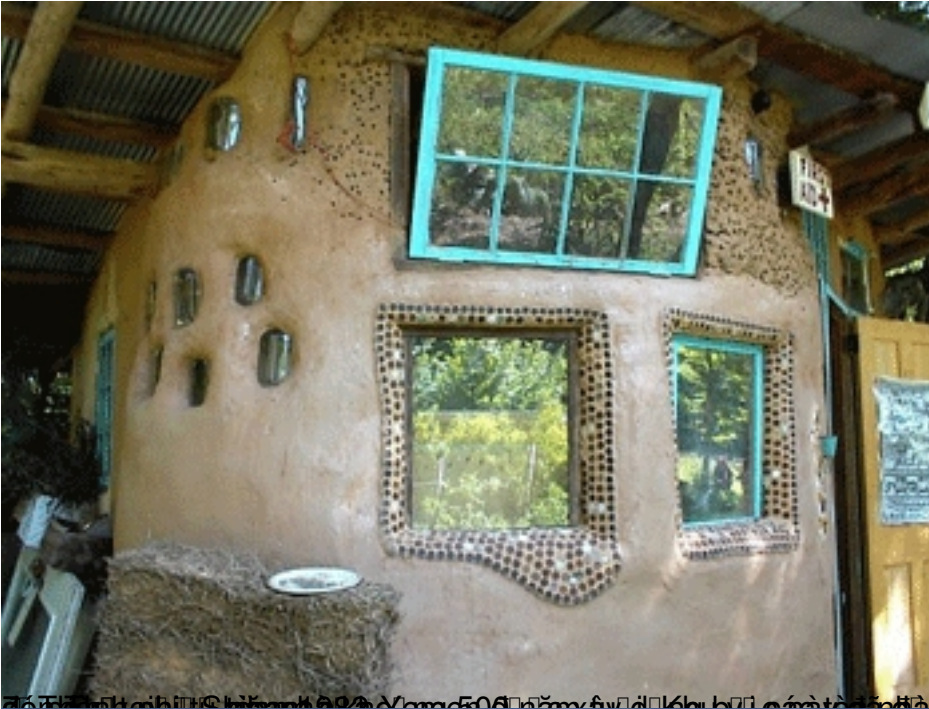
ca b n b n c n m g m h n, t i a D j

T&#225;c Gi&#7843;: Photo/Ki n Trúc Th&#7913; N&#259;m, 17 Th&#225;ng 9 N&#259;m 2009 15:26