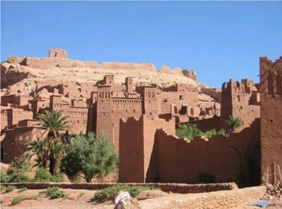
Đền thờ của người Moor ở Timbuktu, Mali. Các đền thờ này được xây dựng từ đất sét và đá vôi, có hình dáng giống như những ngôi nhà.

Tên: Giacobbe; Photo: Kiến Trúc Tháng: 17 Tháng 9 Năm: 2009 15:26