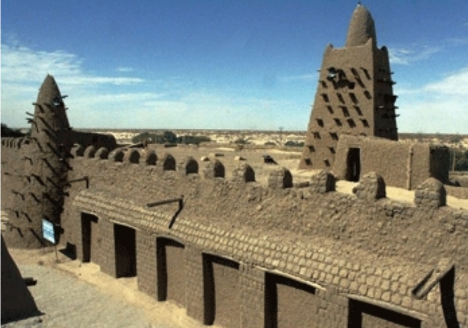
Đền thờ của người Moor ở Timbuktu, Mali. Các đền thờ này được xây dựng từ đất sét và đá vôi, có hình dáng giống như những ngôi nhà.