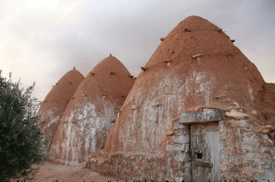
10. Những viên gạch tạo thành từng bùn đất đặc biệt ở Nyeleni, Ma-li.

Th&#7913; N&#259;m, 17 Th&#225;ng 9 N&#259;m 2009 15:26