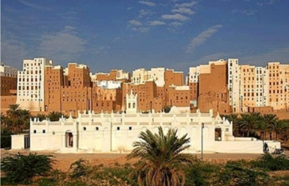
đ i a b n c n v a c a c h a n h g d a c a y n g đ n g. Burkina Faso mang t n b n v n g,